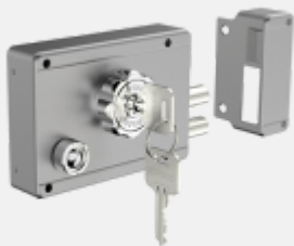
FECHADURA SOBREPOR PY BATE TRAVA INOX ESCOVADO C/TRAVA ROS42