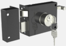
FECHADURA SOBREPOR PY PRETO