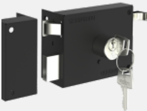
FECHADURA SOBREPOR PRATICE PY PRETO